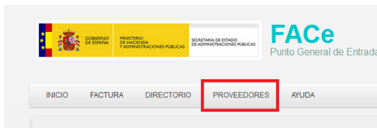
Ilustración 5: Acceso certificados proveedores

La seguridad que implementa FACe a nivel de comunicación por servicios web requiere firmar los mensajes que se remitan a través de esta interfaz con certificado electrónico reconocido soportado por la plataforma @firma del MINHAP, puede comprobar si su certificado es válido en http://valide.redsara.es . FACe permite la autogestión de estos certificados a los proveedores directamente, a través del portal face.gob.es .