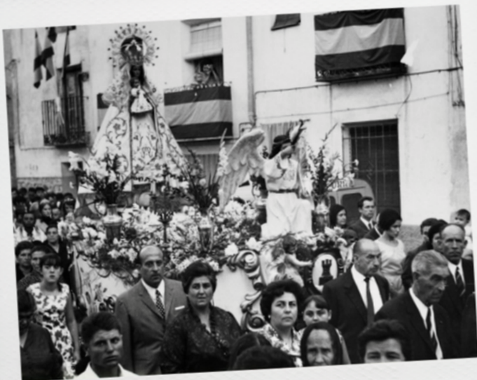
Procesión de la Virgen del Castillo en 1960