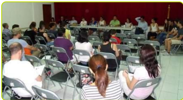
Reunión con la Escuela de Música

La nueva Escuela de Música ha comenzado a funcionar en Perales. La Concejalía de Educación y la Asociación Cultural Atrium convocaron una reunión para informar acerca del nuevo proyecto a todos los vecinos que estuviesen interesados. En este nuevo curso las inscripciones han tenido un notable aumento y desde la Concejalía se trabaja para que la educación musical en Perales sea un eje fundamental y se consolide y desarrolle a través de distintas actividades que hagan de la Escuela Municipal de Música un espacio abierto y que muestre los progresos de los alumnos. Por ello se quiere trabajar para conseguir formar una orquesta o banda musical. Por ello se han añadido nuevas actividades para los más pequeños, a partir de dos años de edad, como música y movimiento, ballet clásico y violín. Os animamos para que este proyecto sea de todos.