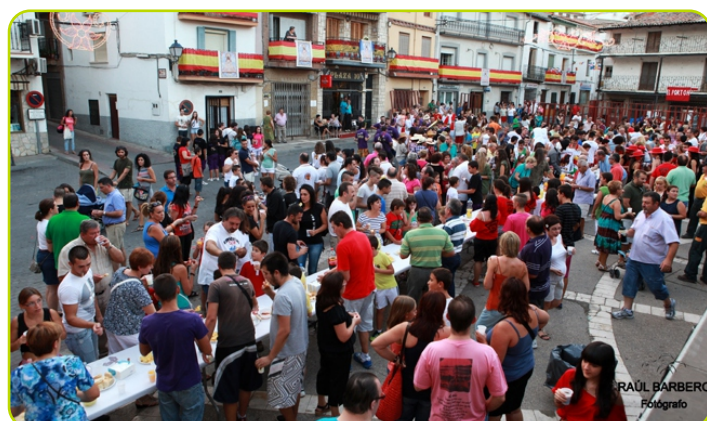
Día de las Peñas

El deporte ha tenido un gran protagonismo, los más deportistas de Peral no se han quedado sin los torneos que se celebran previos a las fiestas y han podido practicar tenis, fútbol, bádminton, baloncesto, ping pong, pádel, natación, etc.