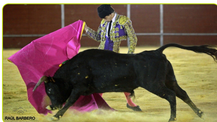
Certamen de Novilladas de la Ribera del Tajuña

Las Fiestas Patronales son el evento más esperado del verano en Peral, y gracias al trabajo y esfuerzo de todos los colaboradores, peñas, asociaciones, empresas patrocinadoras, etc. han sido todo un éxito. Desde aquí damos las gracias a todos ellos y deseamos que el año que el próximo año, vuelvan a ser unas fiestas llenas de alegría y diversión para todos.