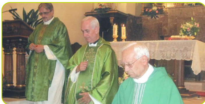
Toma de posesión del nuevo Párroco

Damos la bienvenida al nuevo Párroco de la Iglesia Ntra. Sra. del Castillo y queremos desearle la mejor de las estancias en nuestro pueblo, Perales.