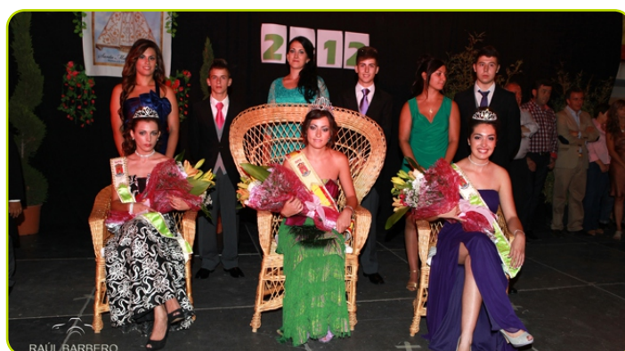
Coronación de las Mises

Por último destacamos, los festejos taurinos, que son sin lugar a dudas uno de los estandartes en las fiestas de Peral