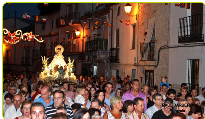
Nuestra Señora Virgen del Castillo

El mes de agosto, ha sido como todos los años, un mes de fiesta y alegría en Peral. Vecinos y visitantes han podido disfrutar de las Fiestas Patronales en honor a Ntra. Sra. la Virgen del Castillo , participado en todas las actividades programadas para todos los gustos y edades.