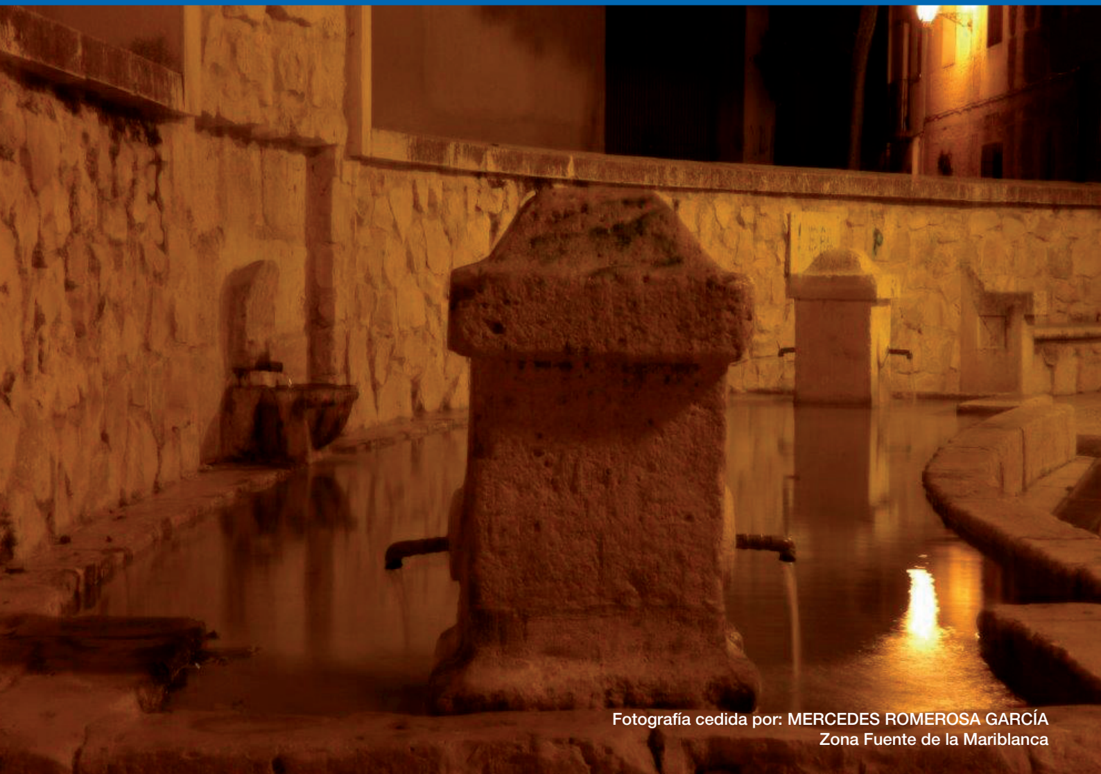
Zona Fuente de la Mariblanca

¿Quieres ver tus fotos en la página web y la Revista de Perales?