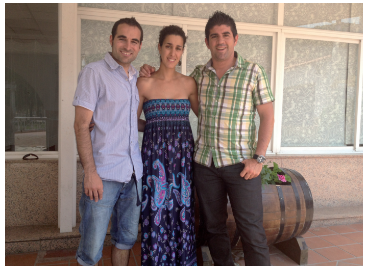
Imagen del Equipo Directivo del Colegio Ntra. Sra. del Castillo

Para nosotros es un placer poder conocerte mejor y te deseamos un gran futuro profesional y personal en Perales.