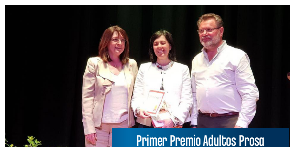
Primer Premio Adultos Prosa