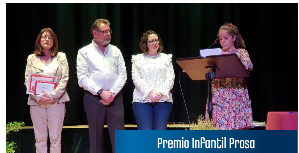
Premio Infantil Prosa