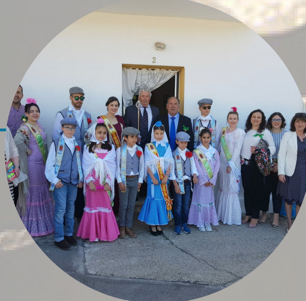
DÍA DE LA VIRGEN