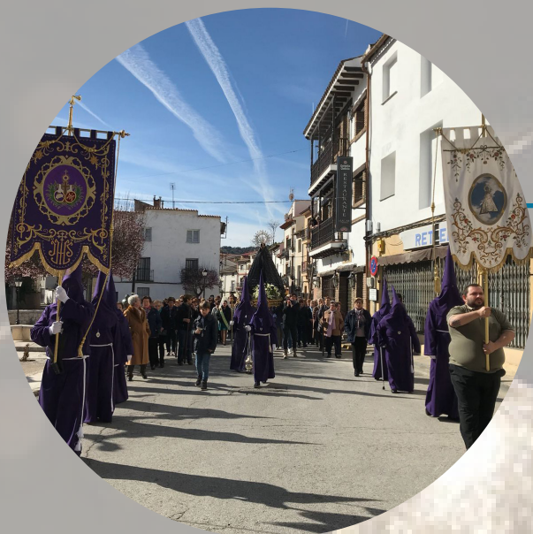
SEMANA SANTA PERALEÑA