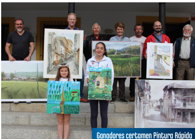
Ganadores certamen Pintura Rápida