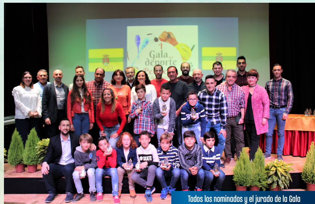
Todos los nominados y el jurado de la Gala