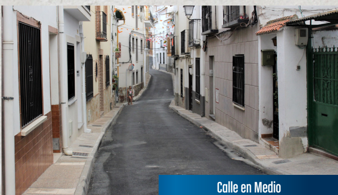
Calle en Medio

CERCA DE 130.000€ DE COSTE TOTAL DE LA RENOVACIÓN