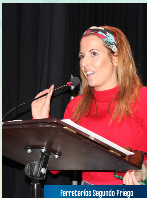
Ferreterías Segundo Priego