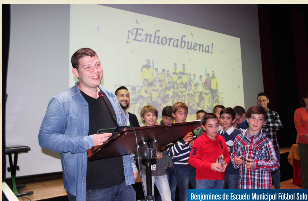
Benjamines de Escuela Municipal Fútbol Sala

Un deportista de éxito, como los cosechados por los benjamines de