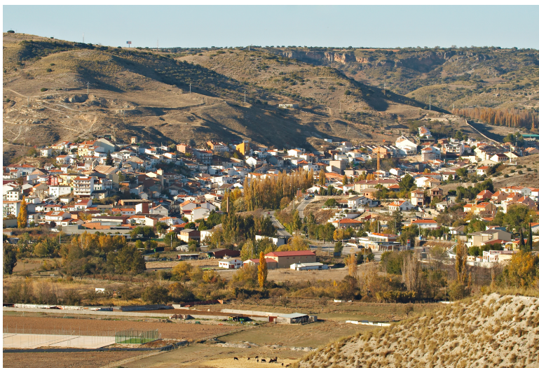
Vista de Perales de Tajuña desde el Cerro de Cabeza de los Bueyes

Finalmente, es importante saber valorar el rico legado cultural que suponen los yacimientos arqueológicos de Perales de Tajuña, no siempre vistosos ni bien conservados, pues constituyen un elemento de interés cultural inigualable. La creciente sensibilización de autoridades responsables, estudiosos especialistas y de la sociedad actual, debe conducir a lograr los medios necesarios para poder valorar y conservar para el futuro este rico legado.