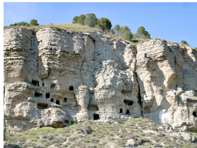
Risco de las Cuevas (monumento Histórico-Artístico en 1931)