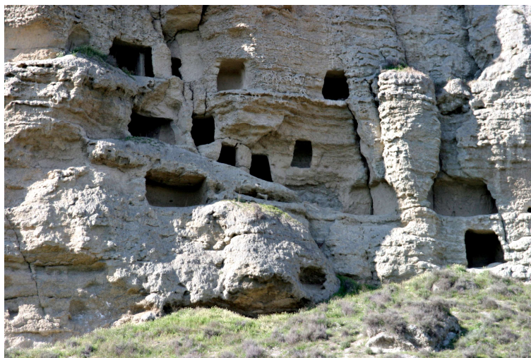
Detalle de algunas de las cuevas del Risco