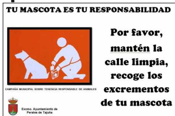
Cartel de la Campaña Municipal de Tenencia Responsable de Animales

Perales cuenta con dos nuevos contenedores destinados al reciclaje de aceites usados , instalados en la Calle Mayor Baja