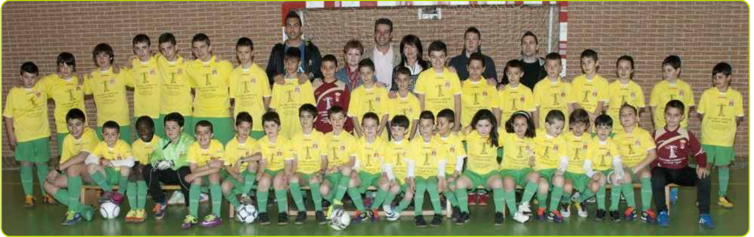
Equipos de la Escuela Municipal de Fútbol Sala

El domingo 11 de marzo fue un día muy especial para los vecinos de Perales, el motivo no es otro que la visita a Perales del Presidente de la Federación Madrileña de Fútbol quien trajo la Copa del Mundo que la Selección Española de Fútbol ganó en el pasado Mundial de Sudáfrica 2010. Las puertas del Polideportivo estuvieron abiertas por la mañana y por la tarde y cientos de peraleños y peraleñas pasaron a verla y hacerse una foto junto a ella.