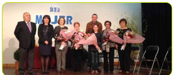
Momento de los actos del Día de la Mujer

De esta manera, Perales quiso conmemorar el Día Internacional de la Mujer, destacando el papel fundamental de la educación de los más pequeños en igualdad.