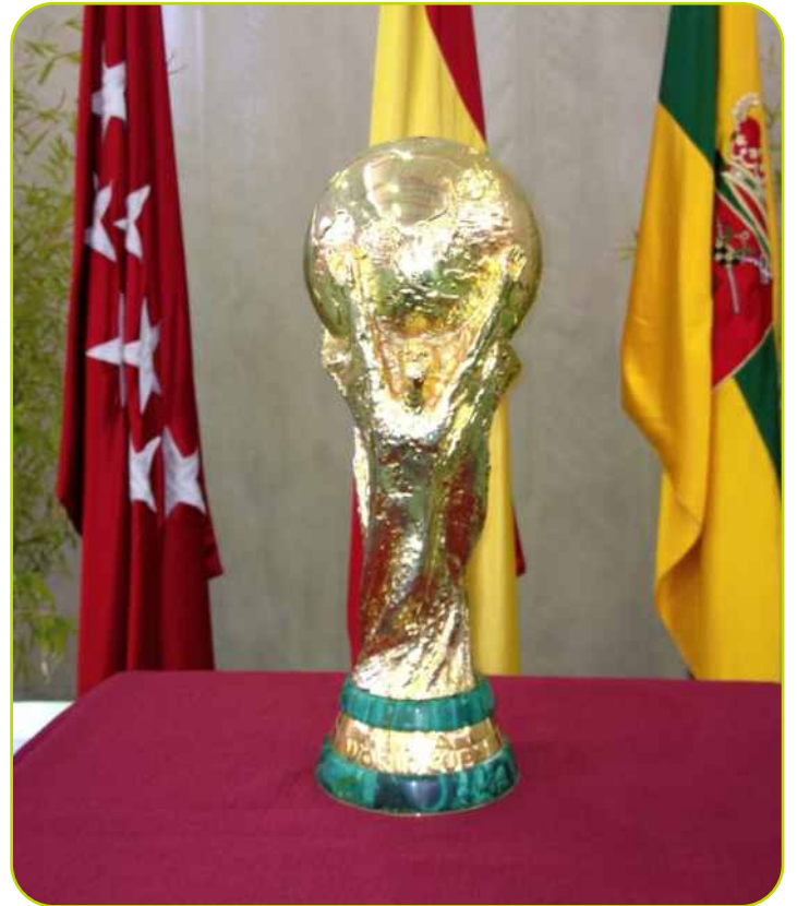
Copa del Mundo