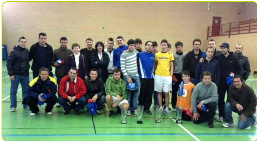
Participantes del Torneo de Tenis Indoor "Villa de Perales"