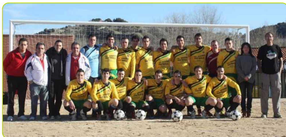
Equipo de 3 a Aficionado de la Federación de Fútbol de Madrid, C.D. Perales

El domingo 22 de enero, día en el que se disputaba la 16 a jornada de la competición de Liga, el equipo de 3 a Aficionado de la Federación de Fútbol de Madrid, C.D. Perales estrenó su nueva equipación. A la cita no faltaron la Alcaldesa del Ayuntamiento, la Concejal de Deportes y representantes de la empresa "Paintball Las Vegas" que han patrocinado las nuevas equipaciones del equipo.