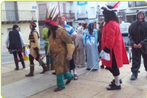
Fiesta de Carnaval

Otro año más, con motivo del Carnaval, grandes y pequeños han mostrado su imaginación, creatividad y buen humor a la hora de elegir y elaborar los disfraces, llenando las calles de Perales de color y alegría.