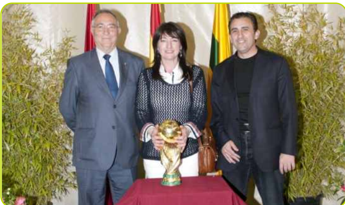
Imagen de la Alcaldesa junto al Presidente Federación Madrileña de Fútbol y el árbitro del partido